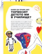
Дипляна за родители „Какво да правя, ако тормозят детето ми в училище?“