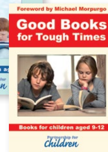
„Хубави книги за трудни моменти“ (на английски език)