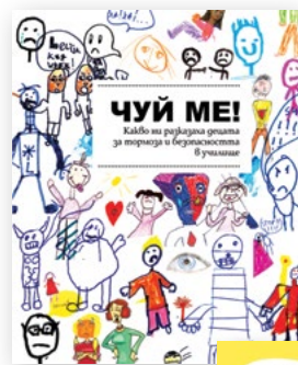
Книжка „Чуй ме!“

Ако ползвате английски език, можете да разгледате и поръчате изданието на Partnership for Children „Хубави книги за трудни моменти“ през уебсайта partnershipforchildren.org.uk